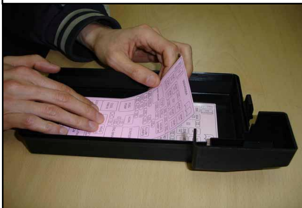
Przyczepianie nowej etykiety.